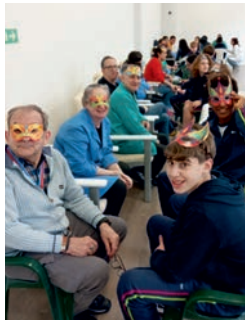
Xuntaza Entroido e Día de Rosalía