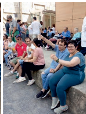
Fiesta de verano