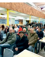
Día del Voluntariado