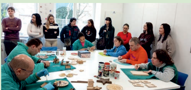
Paso a Paso