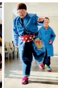
Psicomotricidad y estimulación