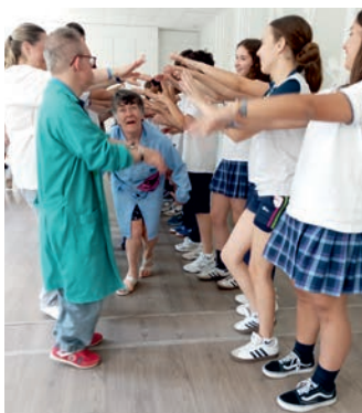
Fin de curso