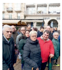
Día de la Discapacidad