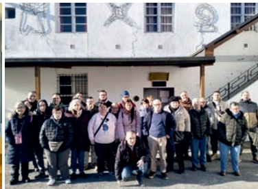
Belén de Begonte