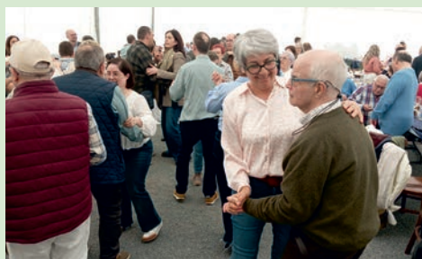
Fiesta de la Familia