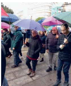
Día de la Discapacidad