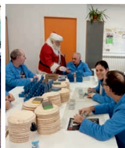
Visita Papá Noel