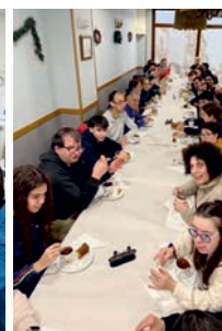
Desayuno y postales