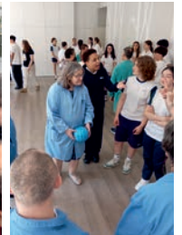
Xuntanza fin de curso