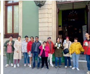
Salida Cuestación AECC