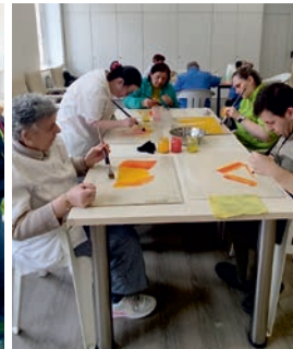
“Acompañamento a Través da Arte”