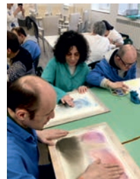
"Acompañamento a Través da Arte"