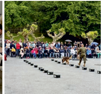
Demostración canina CMT Parga