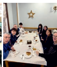
Desayuno e intercambio de postales