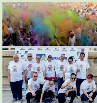
I Holi Run Aspnaís