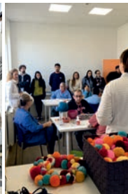
Alumnos Ramón Falcón en Aspanis