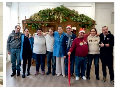
Fiesta Navidad y regalos