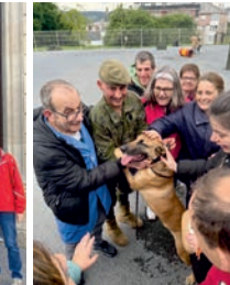
Demostración canina CMT Parga