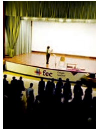
"Festa da Lingua"