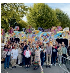
Salida San Froilán