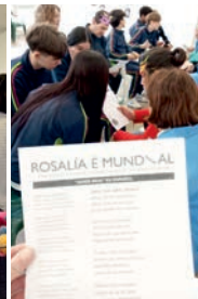
Xuntanza Entroido e Día de Rosalía